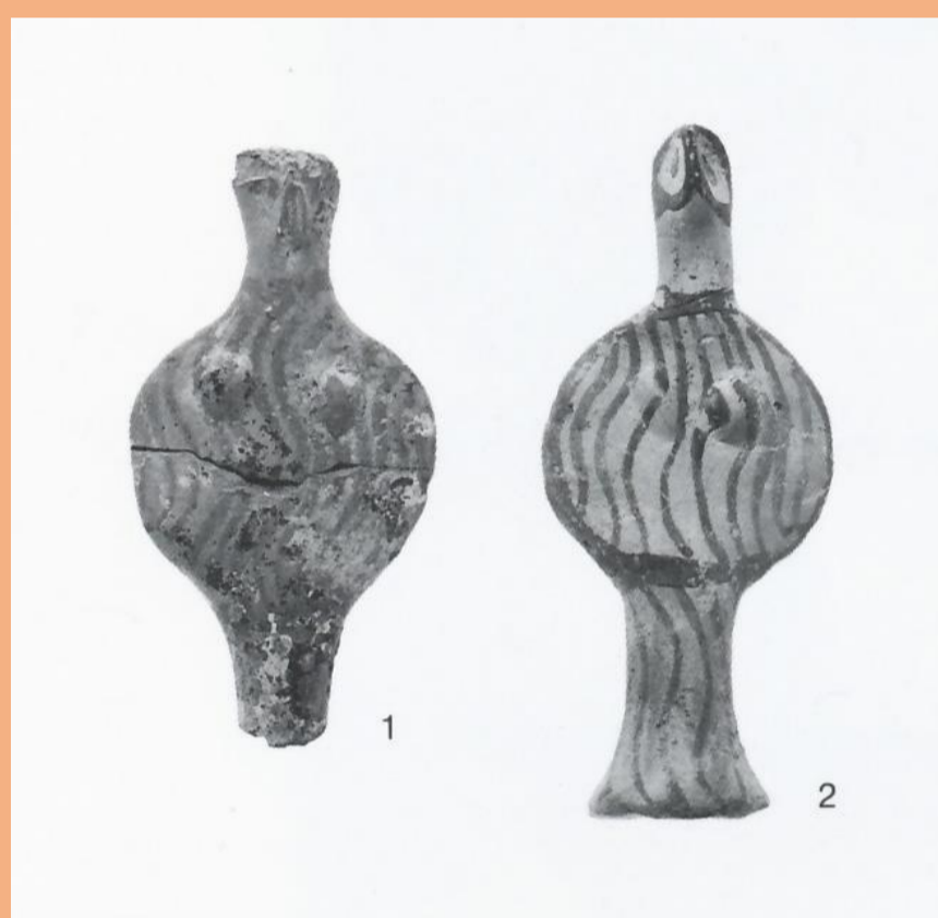
Ειδώλια από το μυκηναϊκό νεκροταφείο της Βάρκιζας