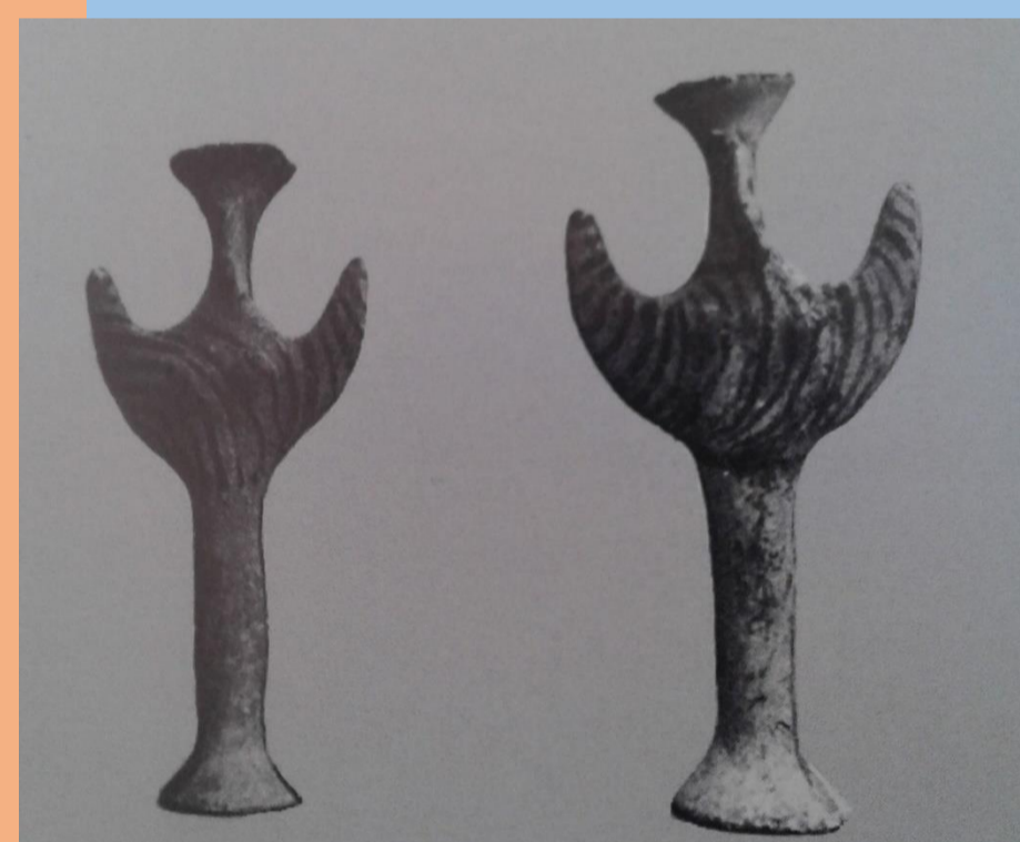
Δύο Φι-σχημα ειδώλια από την Αλυκή Γλυφάδας (ανασκαφή του 1989)

Κατά την περίοδο 2007-2008 πραγματοποιήθηκε μία σωστική ανασκαφή από την Β' ΕΠΚΑ σε οικόπεδο που έδωσε νέα στοιχεία για το μυκηναϊκό νεκροταφείο των Γλυκών Νερών. Σημασία για τη συνάφειά μας έχει ο τάφος 2, στον οποίο μεταξύ άλλων εντοπίστηκε ειδώλιο τύπου Ψ και χρονολογείται στην ΥΕ ΙΙΙΒ περίοδο. Η απουσία οστών στον τάφο, η ύπαρξη του ειδωλίου, οι μικρές διαστάσεις του θαλάμου και τα μικροσκοπικά αγγεία που χρησιμοποιήθηκαν ως κτερίσματα οδηγούν στο συμπέρασμα ότι ο τάφος ανήκε σε νήπιο, γεγονός που ίσως μπορεί να συμβάλει στη σύνδεση παιδικών ταφών και συνοδευτικών ειδωλίων.