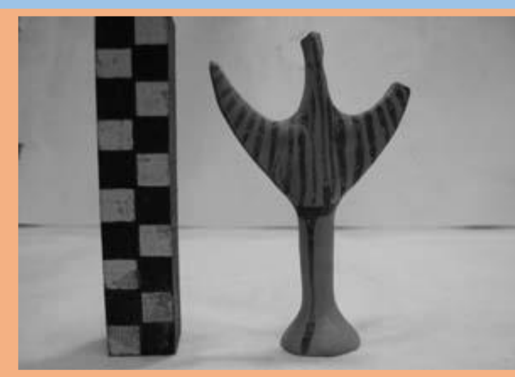
Μυκηναϊκό ειδώλιο Ψ - Φούρτσι, Γλυκά Νερά