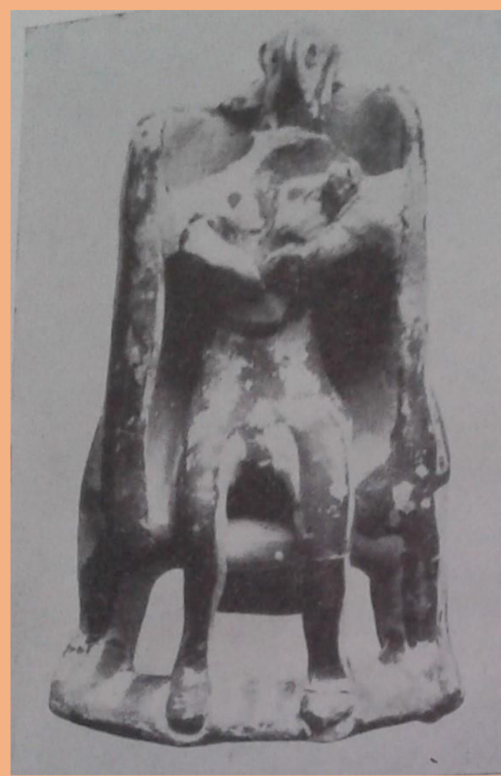
Ειδώλιο Κουροτρόφου Αλυκή Γλυφάδας

Εκατόν ενενήντα δύο τάφοι ανασκάφθηκαν από τον Σπ. Ιακωβίδη στην Περαιτή, οι οποίοι χρονολογούνται στην ΥΕ ΙΙΙΓ. Η αναλογία των ειδωλίων με τις ταφές είναι πολύ μικρή. Βρέθηκαν 7 τύπου Ψ, 7 Ψι-σχημες θρηνωδοί (τμήματα αγγείων), 10 βοοειδή, 3 πτηνόμορφα και 1 θρόνος. Φαίνεται πως πρόκειται για το μοναδικό μυκηναϊκό νεκροταφείο της Αττικής, όπου τα ζωόμορφα ειδώλια εμφανίζονται στον ίδιο περίπου αριθμό με τα ανθρωπόμορφα ίσως και τα υπερβαίνουν. Πιθανότατα, αυτό να αντανακλά μια διαφοροποίηση στην έμφαση που δίνεται στα ειδώλια κατά τη διάρκεια της ΥΕ ΙΙΙΓ στην Αττική. Το ιδιαίτερα ενδιαφέρον σε αυτό το νεκροταφείο είναι η σύμπτωση της παιδικής ταφής με τα ειδώλια. Από τους 15 τάφους που περιείχαν ειδώλια, οι 11 είχαν παιδικές ταφές. Πιθανότατα, να υπάρχει μία αλλαγή κατά την ΥΕΙΙΙΓ στην ιδεολογία γύρω από το θάνατο και τα ταφικά έθιμα στην Αττική ή ακόμη αυτές οι πρακτικές να σχετίζονται μόνο με την ιδεολογία της κοινωνικής ομάδας που ζούσε στην Περαιτή της περιόδου εκείνη.