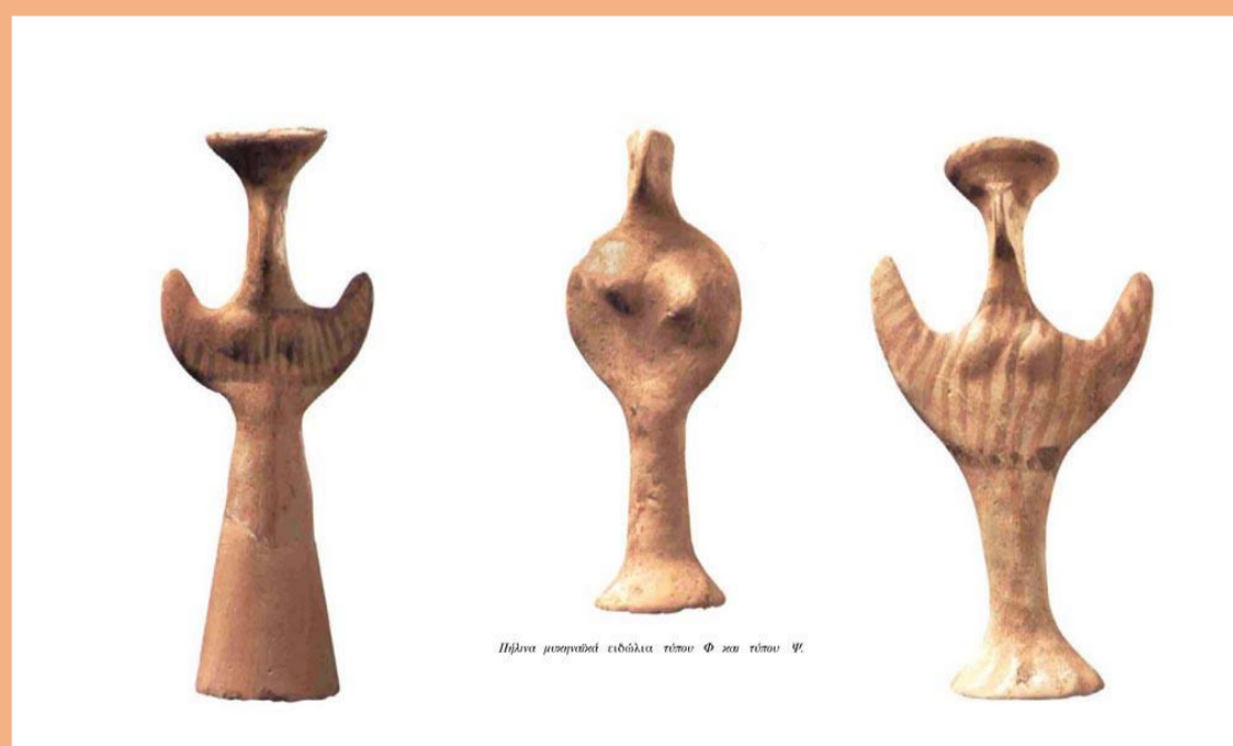
Ειδώλια από τις μυκηναϊκές ταφές στην Ελευσίνα

Από τους υπόλοιπους τάφους που περιείχαν ειδώλια, υπάρχουν ειδώλια που συνόδευαν ταφές παιδιών και άλλα που συνόδευαν ενήλικες. Από την τοποθέτηση των ειδωλίων σε σχέση με τον σκελετό, πιθανότατα να υπήρχε κάποια προτίμηση για ένα ορισμένο μέρος του σώματος που να εξυπηρετούσε έναν συμβολικό-ιδεολογικό χαρακτήρα.