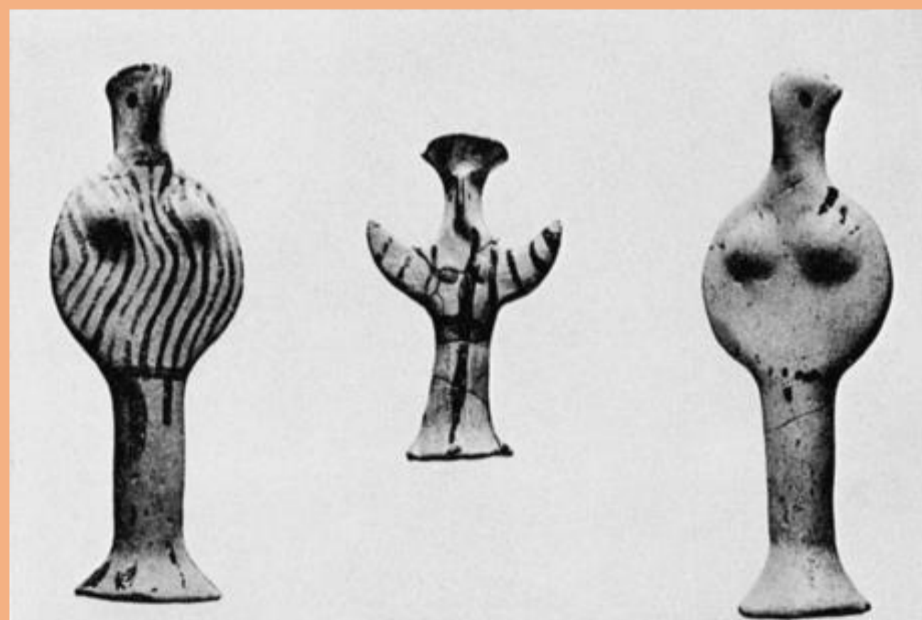
Ειδώλια από ταφές της Αγοράς των Αθηνών

Αν και τα στοιχεία από την Αγορά φαίνεται να υποστηρίζουν τη σύνδεση των ειδωλίων με παιδικές ταφές, εντούτοις ένας τάφος στην Αθήνα, παρουσιάζει ειδώλια να έχουν κατατεθεί σε μία γυναικεία ταφή. Συγκεκριμένα, το 1993 ΝΔ του λόφου του Φιλοπάππου ανασκάφηκε ένας ΥΕΧ κιβωτιόσχημος τάφος που περιείχε μια ΥΕ ΙΙΙΒ2 γυναικεία ταφή. Δύο ζωόμορφα και έντεκα γυναικεία ειδώλια βρέθηκαν μαζί με τη νεκρή. Αυτό είναι ένα σημαντικό παράδειγμα που συνδέει την ταφή ενός ενήλικα μαζί με ειδώλια με έναν τύπο τάφου στον οποίο δεν βρίσκονται συχνά ειδώλια, καθώς οι κιβωτιόσχημοι τάφοι δεν είναι ιδιαίτερα δημοφιλείς στην ΥΕ ΙΙΙ περίοδο, εποχή παραγωγής των περισσότερων μυκηναϊκών ειδωλίων.