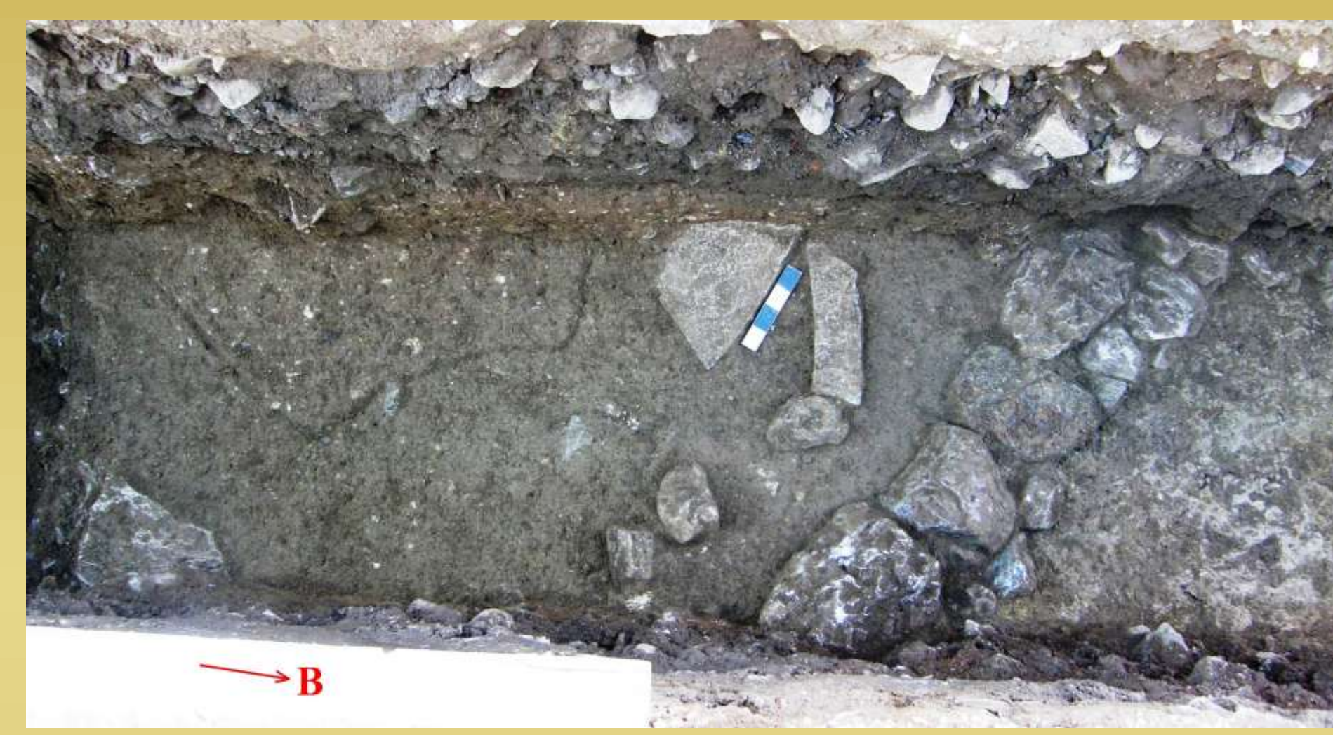
ΕΙΚ.3 ΤΜΗΜΑ ΤΟΙΧΟΥ ΚΑΙ ΔΑΠΕΔΟ ΧΡΗΣΗΣ

Μεγάλος είναι ο αριθμός της κεραμικής που συλλέχθηκε, από όλα τα σημεία με ποικίλα σχήματα αγγείων οικιακής κυρίως χρήσης, χαρακτηριστικών της εποχής. Η πλειονότητα των διαγνωστικών οστράκων και τμημάτων αγγείων προέρχεται από ανοικτά αγγεία, φιάλες (Εικ.4) ή λεκανίδες καθώς επίσης και από κλειστά αγγεία, πυξιδόσχημα (Εικ.5), αμφοροειδή, μικρές και μεγάλες πρόχους (Εικ.6,7), τυπικά της ΠΕ I περιόδου. Επίσης συλλέχθηκαν πήλινα σφονδύλια, λίθινα εργαλεία οψιανού (Εικ.8) και όστρεα θαλάσσης.