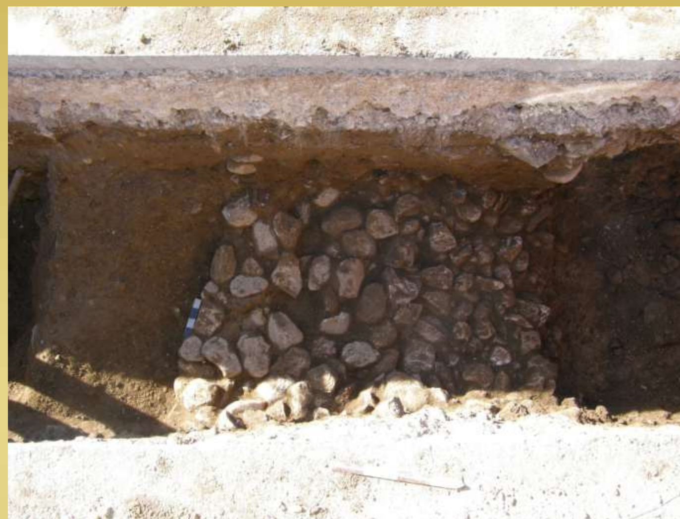
ΕΙΚ.2 ΛΙΘΟΣΤΡΩΤΟ ΔΑΠΕΔΟ