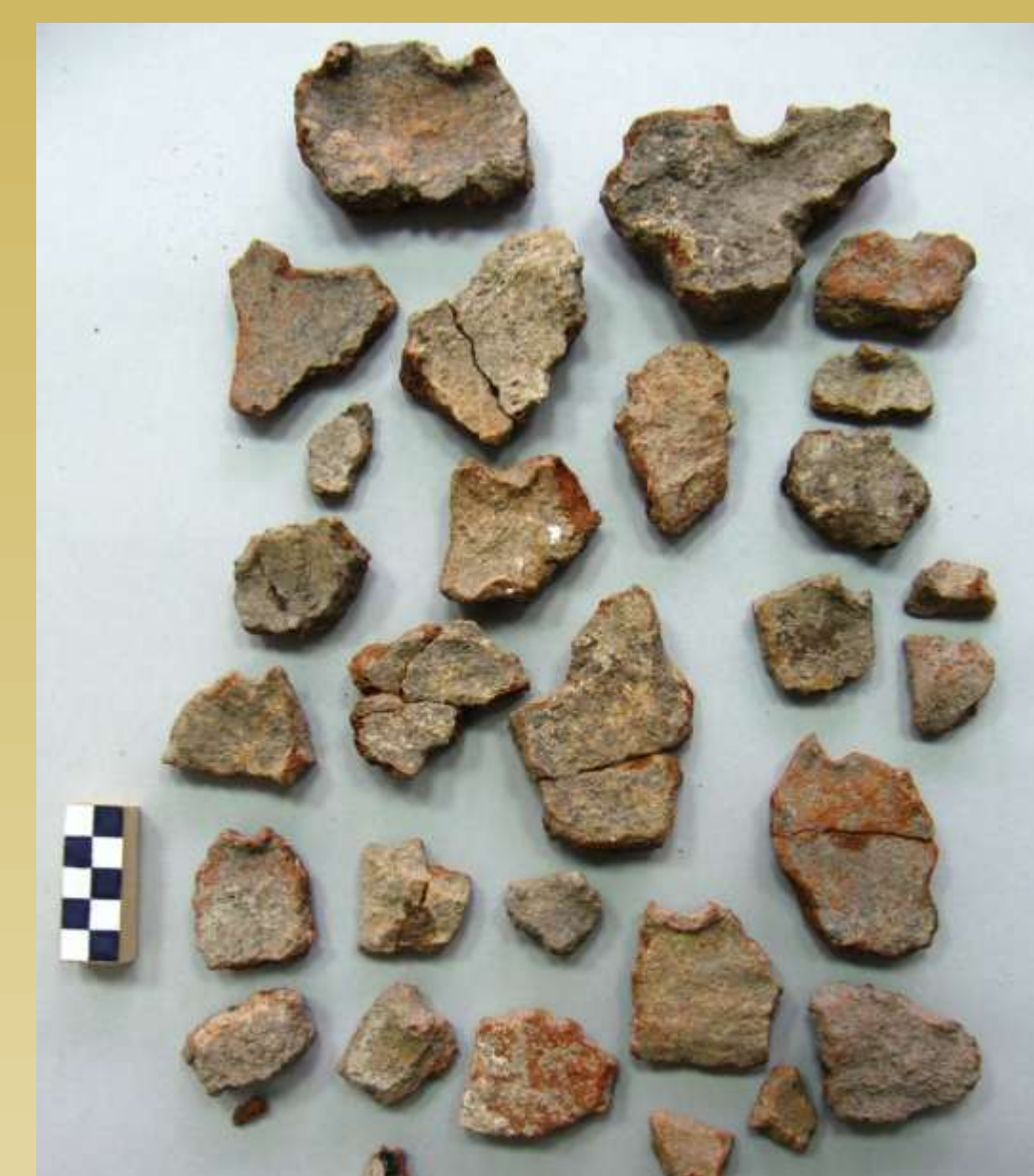
ΕΙΚ.11 ΘΡΑΥΣΜΑΤΑ ΚΑΜΙΝΟΥ

Η σύνθεση των ανασκαφικών δεδομένων και των ευρημάτων προσθέτουν μία ακόμα θέση οικισμού στον προϊστορικό χάρτη της Αττικής, αυξάνοντας την πυκνότητα της κατοίκησης στην ευρύτερη περιοχή της ανατολικής Αττικής κατά την Πρώιμη Εποχή του Χαλκού, με την περιοχή του Γέρακα να εντάσσεται πλέον μετά βεβαιότητας στον γεωγραφικό ορίζοντα της προϊστορικής κατοίκησης της Αττικής.