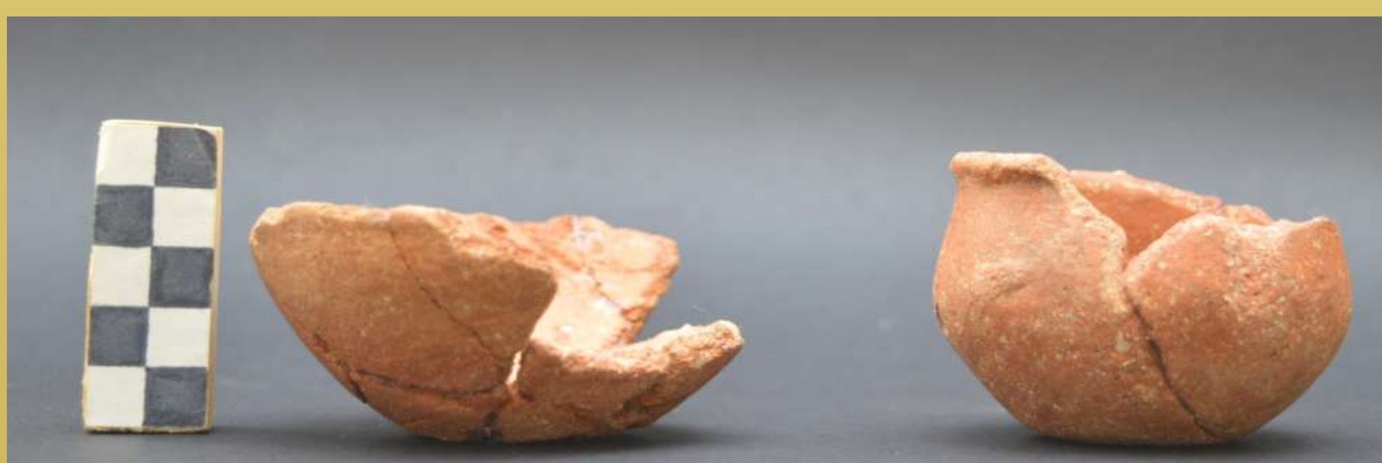
ΕΙΚ.4 ΜΙΚΡΟΓΡΑΦΙΚΑ ΑΓΓΕΙΑ

Όστρακα από ραμφότομες φιάλες, τον χαρακτηριστικότερο τύπο αγγείου της ΠΕ II περιόδου προέρχονται από το Σημείο 17 ενώ από τον λάκκο απόρριψης (ΣΗΜΕΙΟ 19) συλλέχθηκαν μεταξύ άλλων 29 πήλινα θραύσματα, με οπές ανά 3εκ., που παραπέμπουν στον τύπο της μεταλλουργικής καμίνου με διατρήσεις (Εικ.11).