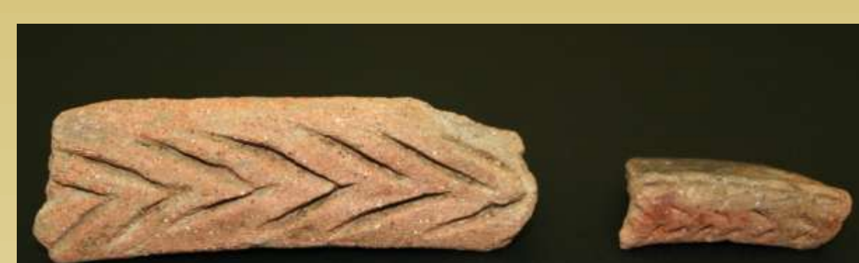
ΕΙΚ.10 ΧΕΙΛΗ ΜΕ ΔΙΑΚΟΣΜΗΣΗ ΕΓΧΑΡΑΚΤΟΥ ΨΑΡΟΚΟΚΚΑΛΟΥ

Η σύνθεση των ανασκαφικών δεδομένων και των ευρημάτων προσθέτουν μία ακόμα θέση οικισμού στον προϊστορικό χάρτη της Αττικής, αυξάνοντας την πυκνότητα της κατοίκησης στην ευρύτερη περιοχή της ανατολικής Αττικής κατά την Πρώιμη Εποχή του Χαλκού, με την περιοχή του Γέρακα να εντάσσεται πλέον μετά βεβαιότητας στον γεωγραφικό ορίζοντα της προϊστορικής κατοίκησης της Αττικής.