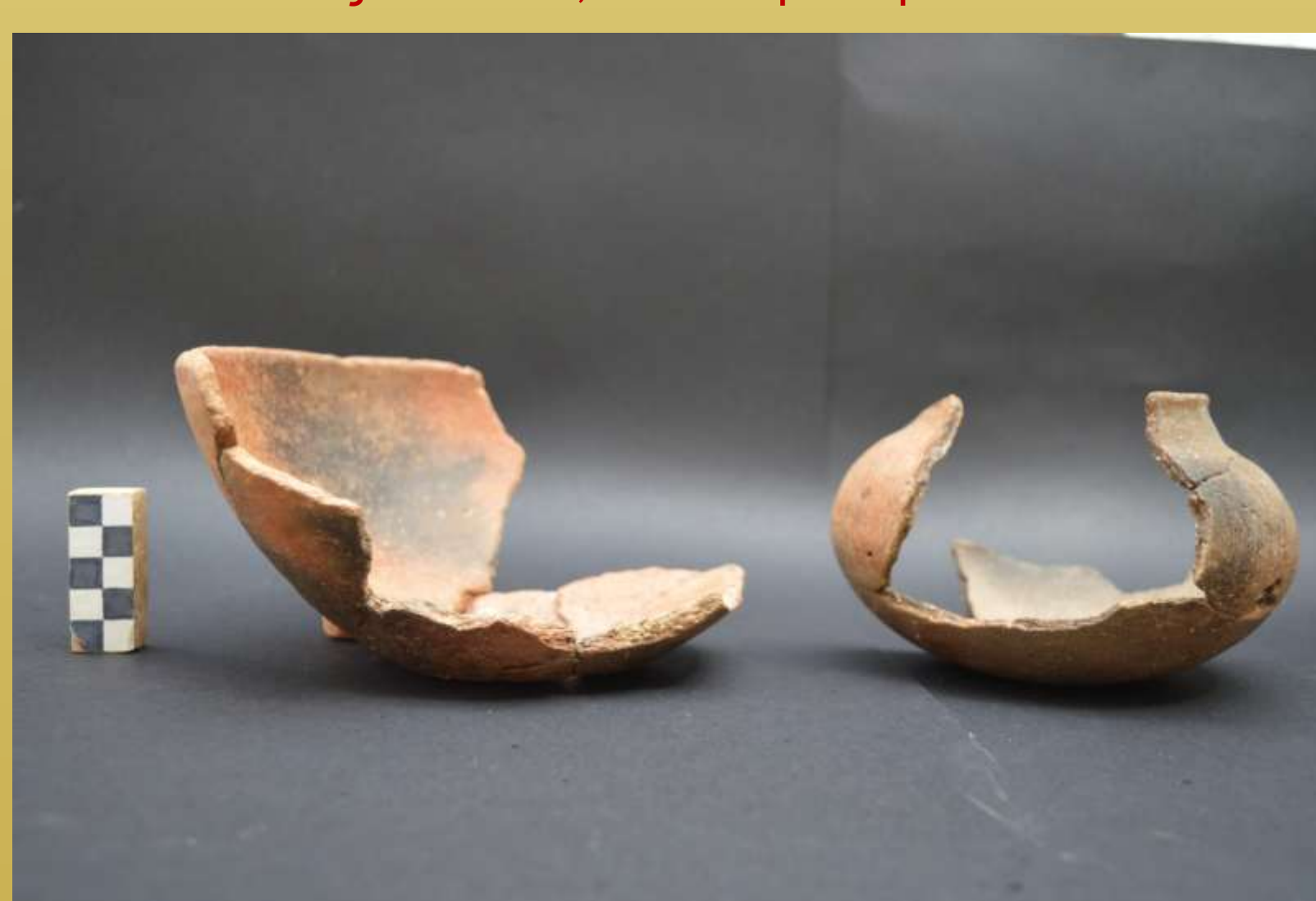
ΕΙΚ.5 ΦΙΑΛΗ ΚΑΙ ΠΥΞΙΔΟΣΧΗΜΟ ΑΓΓΕΙΟ