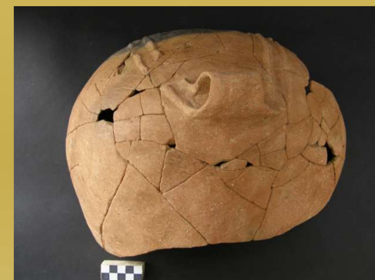
ΕΙΚ.9 ΑΓΓΕΙΟ ΜΕ ΠΛΑΣΤΙΚΗ ΔΙΑΚΟΣΜΗΣΗ