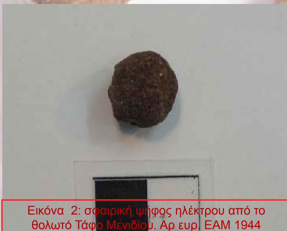
Εικόνα 2: σφαιρική ψήφος ηλέκτρου από το θολωτό Τάφο Μενιδίου. Αρ. ευρ. ΕΑΜ 1944

3) ΥΕΙΙΒ, Θολωτός Τάφος, Μενίδι. Ήρθαν στο φως μία σφαιρική ψήφος με μία διατετηρημένη κωνική εξόγκωση, ίσως περίαπτο, και μία μικρότερη σφαιρική. Η πρώτη ψήφος αποτελεί και πάλι μοναδική περίπτωση στην προϊστορική Μεσόγειο σε έναν τάφο με ποικίλα ευρήματα χρυσού, διακοσμητικών λίθων, ελεφαντόδοντου