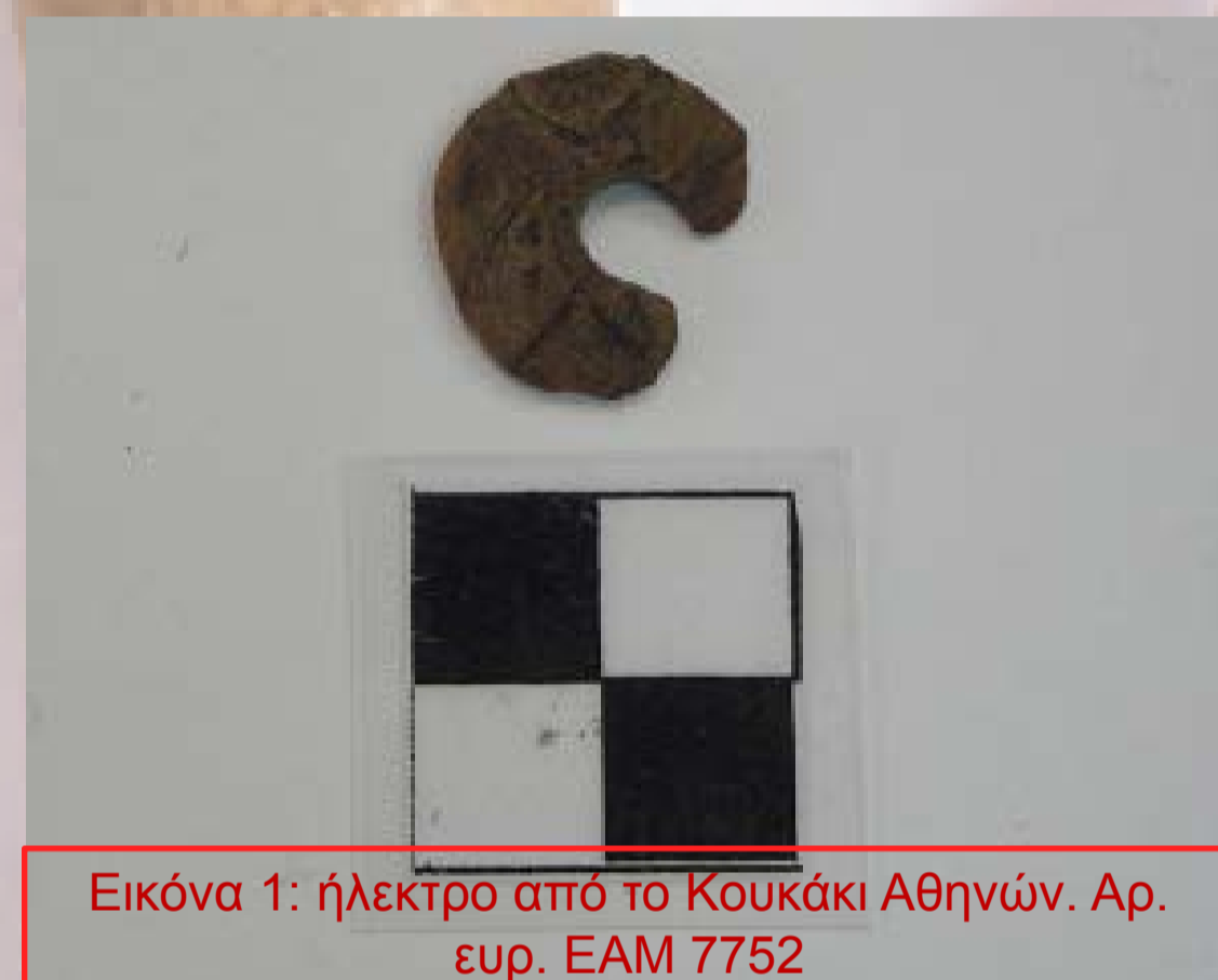
Εικόνα 1: ήλεκτρο από το Κουκάκι Αθηνών. Αρ. ευρ. ΕΑΜ 7752

1) ΥΕΙΙΑ, Τάφος 17, Κουκάκι: Ανακαλύφθηκε ένας δακτύλιος από ήλεκτρο και τμήμα από δεύτερο ανάμεσα σε χρυσά κτερίσματα, σε ψήφους υαλόμαζας και αποτμήματα ελεφαντόδοντου. Χαρακτηριστικός ο σχηματισμός γραμμών σε σχήμα «Λ» στις όψεις του, υπίσιμ σε ολόκληρη την προϊστορική Μεσόγειο